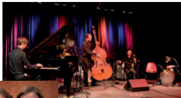
Ahoar Bundessieger 2006/07